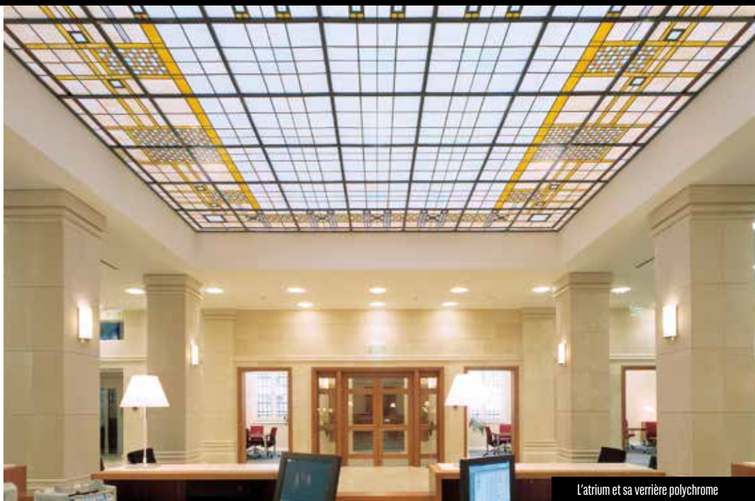
L'atrium et sa verrière polychrome

nouvelle ambassade d'Italie, l'église Saint-Antoine de Padoue et plusieurs sièges de banque. Entre 1926 et 1929, il participe activement à la définition du plan topographique et monumental de la nouvelle capitale Ankara.