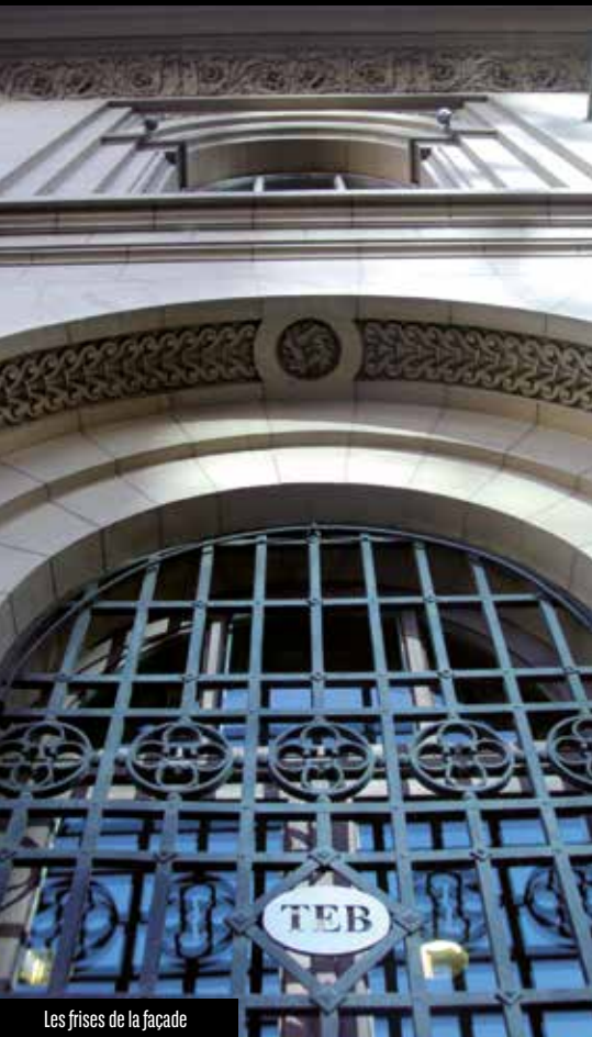
Les frises de la façade

quartiers historiques. Néanmoins, Izmir a pu conserver son atout principal, son port, comme elle a toujours su le faire au cours de sa longue histoire, jalonnée par les destructions et reconstructions, consécutives aux invasions, incendies et tremblements de terre.