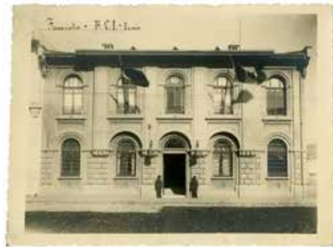
BCI : façade et entrée principale, 1935

À l'origine, l'adresse de l'agence de la BCI est Deuxième rue, voie surnommée rue Parallèle, car située juste derrière les quais du port, le quartier se nommant Konak . C'est l'une des artères principales, celle où se sont installés au fil du temps les établissements bancaires, qu'ils soient nationaux ou étrangers. Cette partie de la ville porte encore les marques de l'incendie de 1922 , qui l'a dévastée en grande partie, anéantissant l'organisation sociale et spatiale de