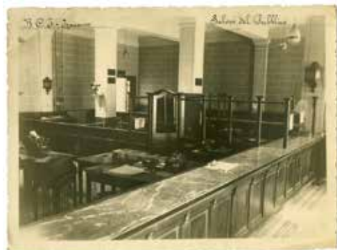
BCI : l'atrium et son guichet central, 1935