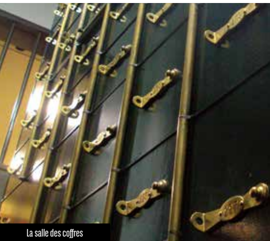
La salle des coffres

inauguration en 1928, cette architecture, aux décors traditionnels , est déjà considérée comme passée de mode par le courant moderniste, faisant référence au rationalisme et au fonctionnalisme, encouragé par la République. La façade du rez-de-chaussée est ornée à la manière des pierres de Dikili , qui embellissaient des édifices anciens du quartier, comme l'école italienne pour filles. Une frise court sous la toiture, divisée en cinq sections par les quatre piliers qui encadrent les fenêtres cintrées.