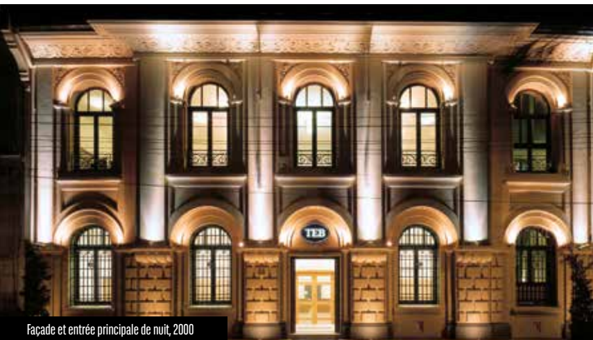
Façade et entrée principale de nuit, 2000

L'immeuble, situé Cumhuriyet Bulvarı 66, dans le quartier d'Alsancak, est une commande de la « Banca Commerciale Italiana » (BCI) auprès de l'architecte levantin Giulio Mongeri, pour abriter sa nouvelle agence d'Izmir. Il a été inauguré en 1928 et est aujourd'hui classé monument historique. L'agence ferme en 1979, faisant entrer le bâtiment dans une période d'incertitude, qui s'achève avec sa vente, en 1988, à Türk Ekonomi Bankası (TEB). TEB est à l'origine une banque régionale, créée en 1927 par un groupe d'entrepreneurs d'Izmit, sous le nom de Kocaeli Bankası. C'est lors de son achat par le groupe Çolakoğlu, en 1982, qu'elle prend le nom TEB et devient une banque reconnue à la fois pour sa solidité, sa gestion prudente et son savoir-faire en opérations internationales. En février 2005, TEB signe un partenariat avec le Groupe BNP Paribas. Puis, en février 2011, soit deux ans après le rapprochement de BNP Paribas et Fortis Bank, la filiale turque de la banque belge, Fortis Bank AŞ, et TEB fusionnent. Ce regroupement reste l'une des fusions les plus réussies de l'histoire bancaire turque.